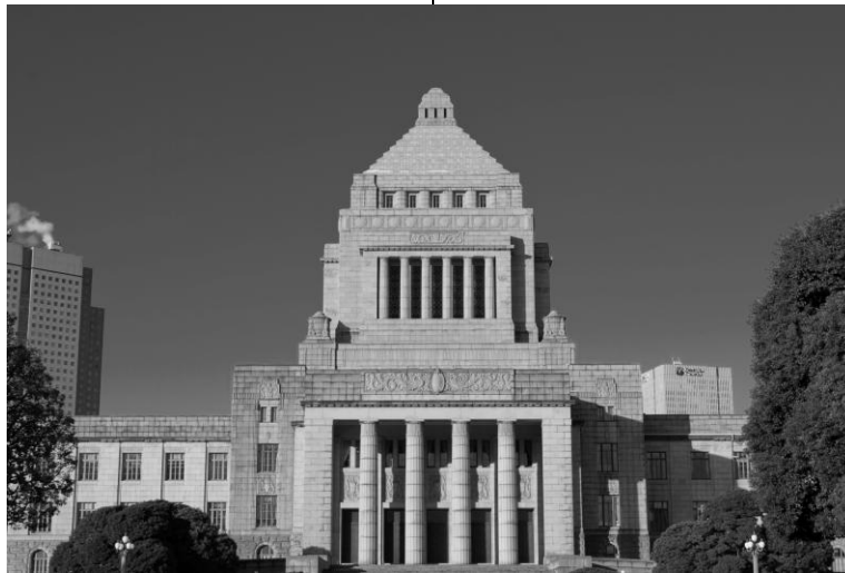
国会議事堂は、正面に向かって左側に衆議院、右側に参議院が配置されています。

怒りやこみあげる想いがあります。多くの悲しみに押しつぶされそうになる日もあります。けれどそれは私だけじゃない。ひさし