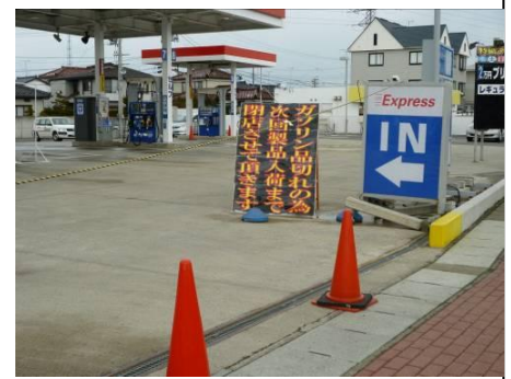
品切れのため閉店する ガソリンスタンド

※なお、救急救命など生命に関わること、緊急性の高い事柄についてはこれまで同様個別に対応してまいりますので、お知らせください。